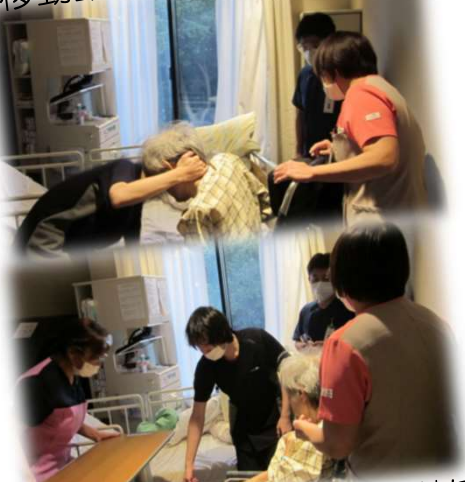
移動動作カンファレンス

各診療科の医師が回診し、患者さまの状態を医師・看護師・リハビリ訓練士等と共有しています